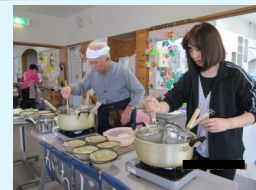
かわじ亭!「うどん一丁」「ハイっ!!」

かわじデイサービスでは、在宅の虚弱老人、寝たきり老人、身障者などを、リフト付き自動車などで自宅からデイサービスセンターに送迎して、各種サービスを提供することにより、心身機能の維持、活性化、生活上の支援及び介護されているご家族の負担の軽減を図ることを目的としています。