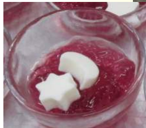
ヨーグルトアイス作り方