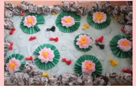
蓮の花・金魚の池