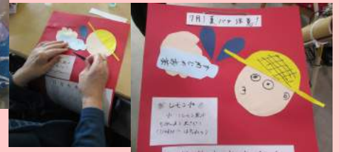
夏バテ注意カレンダー