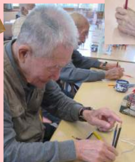
真剣にバランスゲーム 皆さん集中